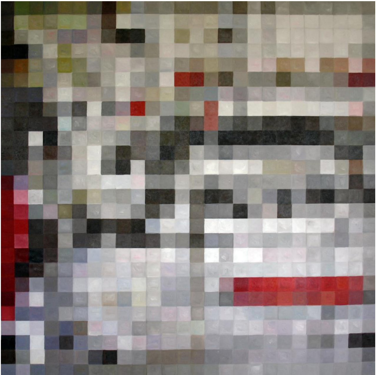
Jan-Hendrik Pelz, Ohne Titel (Item), 2014, Öl auf Leinwand, 100 x 100 cm Jan-Hendrik Pelz, Untitled (Item), 2014, Oil on canvas, 100 x 100 cm